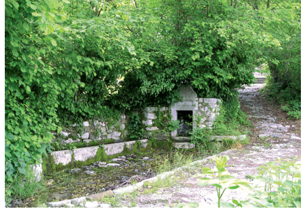
La fontana The fountain

The proximity of the "Pucit" and the typology of the Dominisia fountain rude off its usage as wash-board.