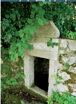
Particolare dell'opera di presa Detail of the adduction basin

Il toponimo che identifica la fontana è riconducibile al soprannome che identifica anche la vicina abitazione come “in da Laurinçut”.